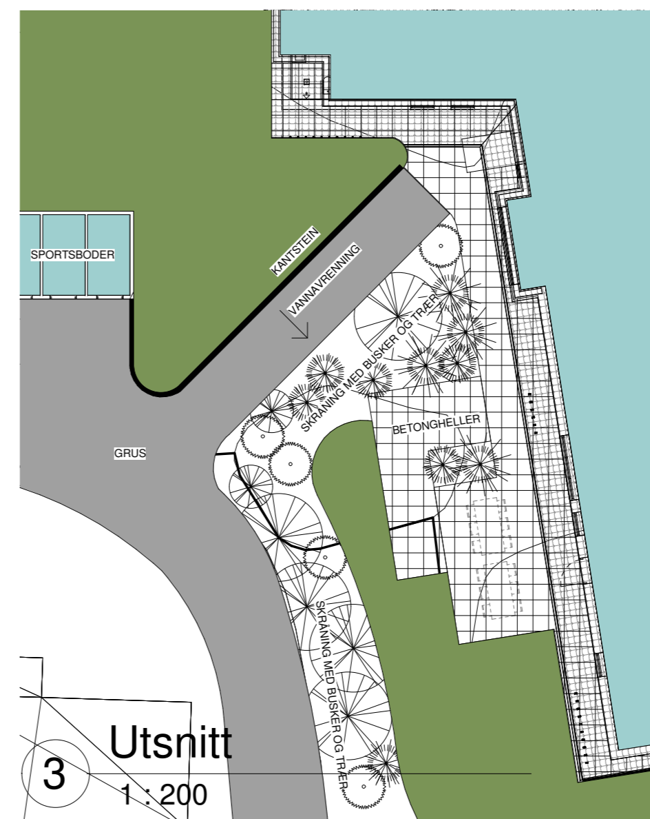
3 Utsnitt 1 : 200