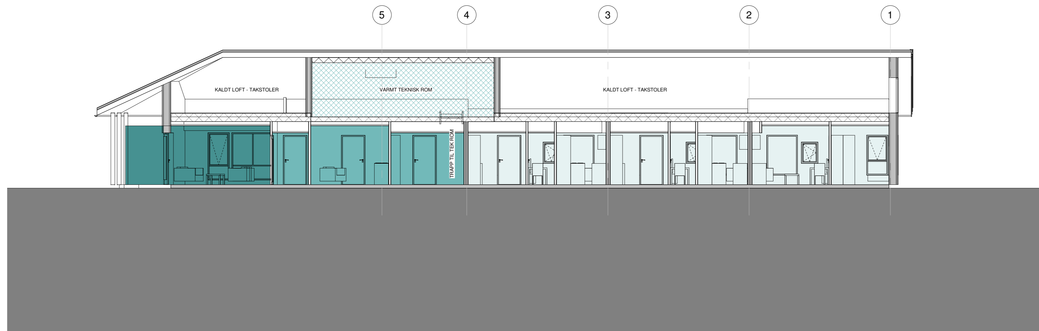
4 DD 1 : 100