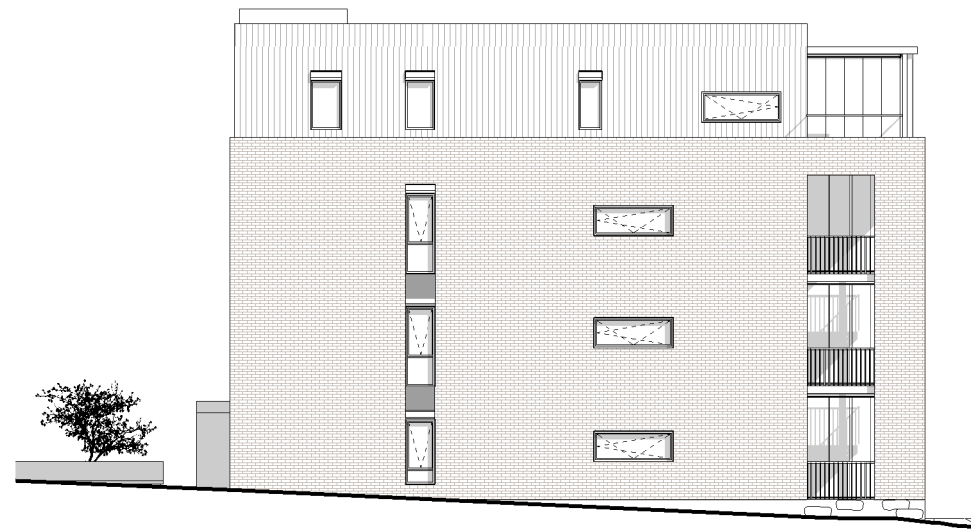
1 NORD (mot Bryggeriet 1) 1 : 200