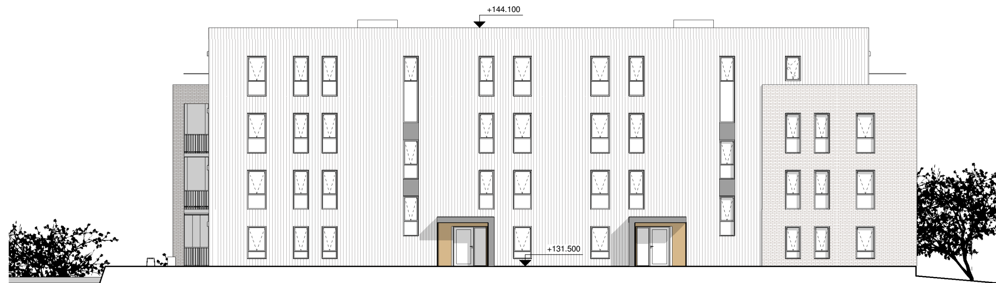
3 ØST (mot gårdsrom) 1 : 200