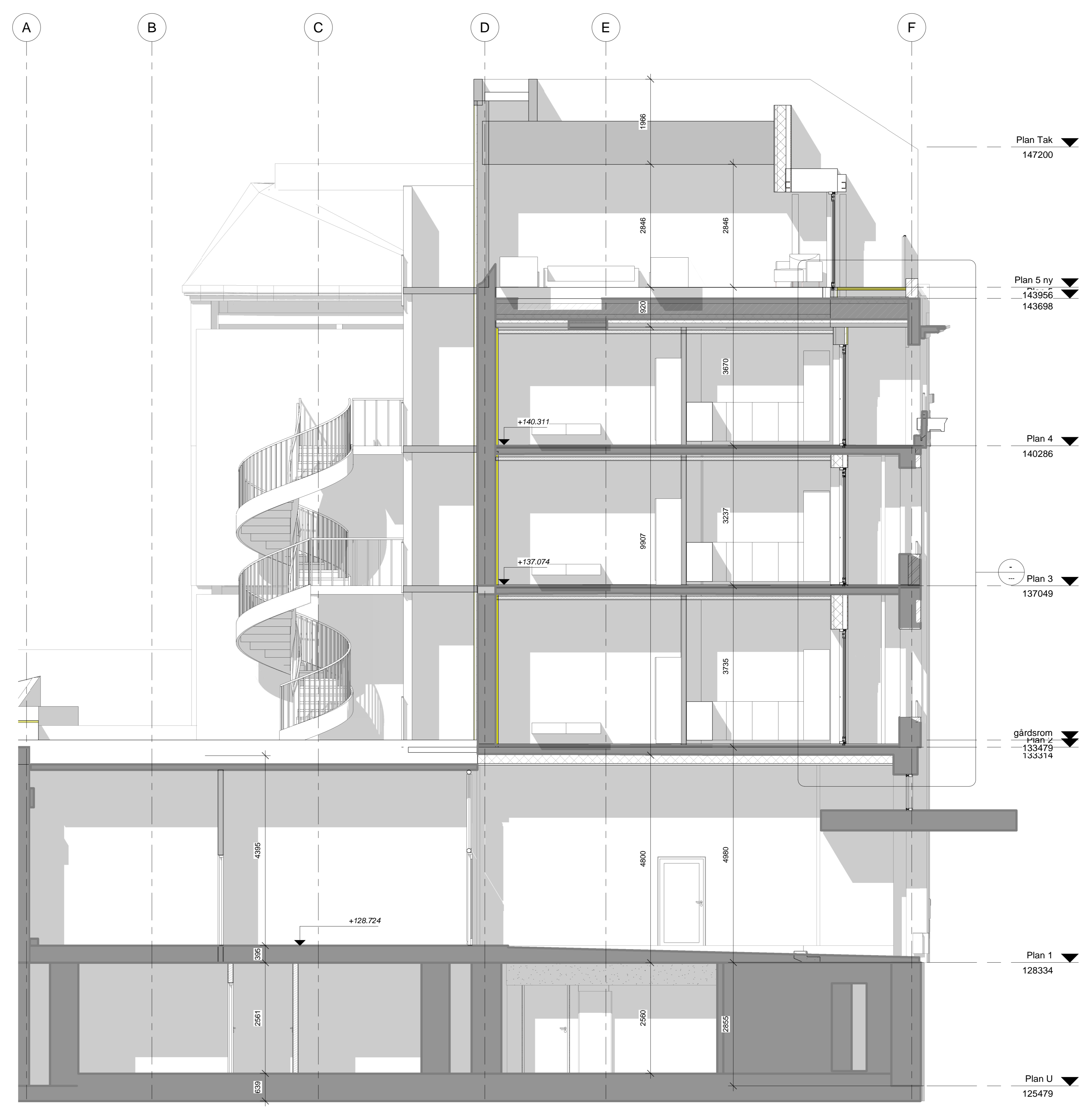
6 Snitt 4 1 : 50